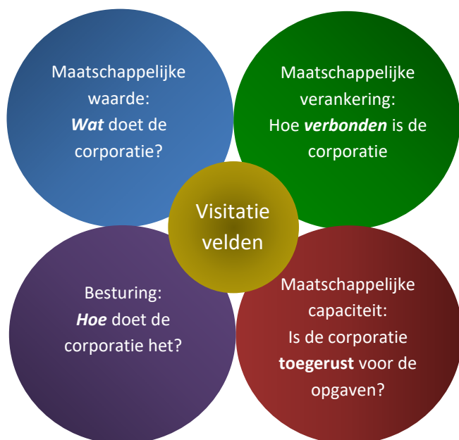
Figuur 1. Een nieuwe samenhang tussen visitatievelden

Grafisch weergegeven ziet dit er als volgt uit: